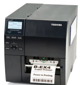
B-EX4 gama superior de impresoras industriales con precio de gama media para una amplia variedad de aplicaciones